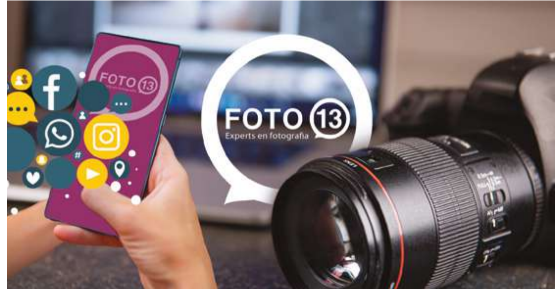
Foto 13, bajo la dirección de Ignasi Font, fotógrafo profesional de Tarragona, se dedica exclusivamente a la creación de fotografía y vídeo por empresas. Con amplia experiencia en el sector, desarrollan contenido visual de alta calidad, preparado específicamente para las redes sociales, webs, espacios de restauración, establecimientos hoteleros y un largo etcétera. Su pasión y dedicación se reflejan en cada proyecto, garantizando imágenes que realzan la imagen de marca de sus clientes.

Foto 13, sota la direcció d'Ignasi Font, fotògraf professional de Tarragona, es dedica exclusivament a la creació de fotografia i vídeo per empreses. Amb una àmplia experiència en el sector, desenvolupen contingut visual d'alta qualitat, preparat específicament per a les xarxes socials, webs, espais de restauració, establiments hotelers i un llarg etcètera. La seva passió i dedicació es reflecteixen en cada projecte, garantint imatges que realcen la imatge de marca dels seus clients.